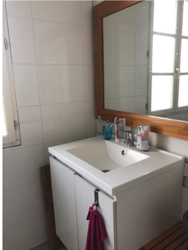
Vue sur l'extérieur depuis la salle de bains